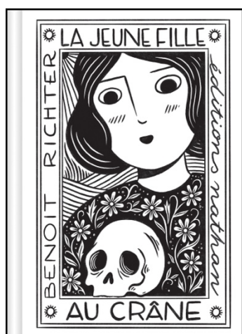
La Jeune Fille au crâne Benoît Richter, Nathan