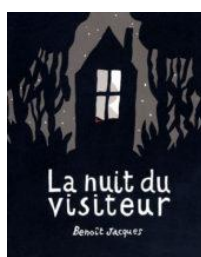
La Nuit du visiteur (2008, Baobab de l'album)