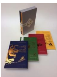
Légende de Pioung Fou (Livres 1, 2, 3, de 2012 à 2017)