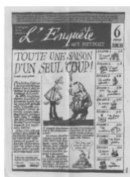
Journal : L'enquête qui piétinait , l'intégrale de la saison 1, 2025