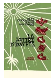
La lettre d'Égypte (2023)