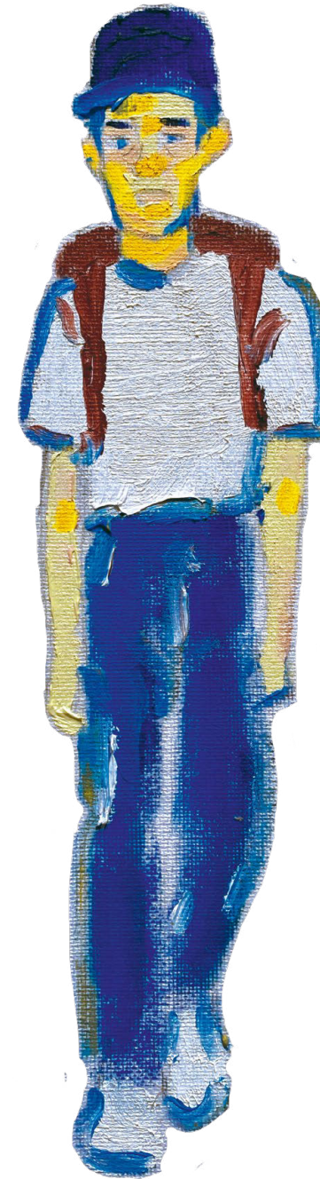
Kid a 10 ans. Il est en cm2 à l'école Ralph Waldo Emerson.